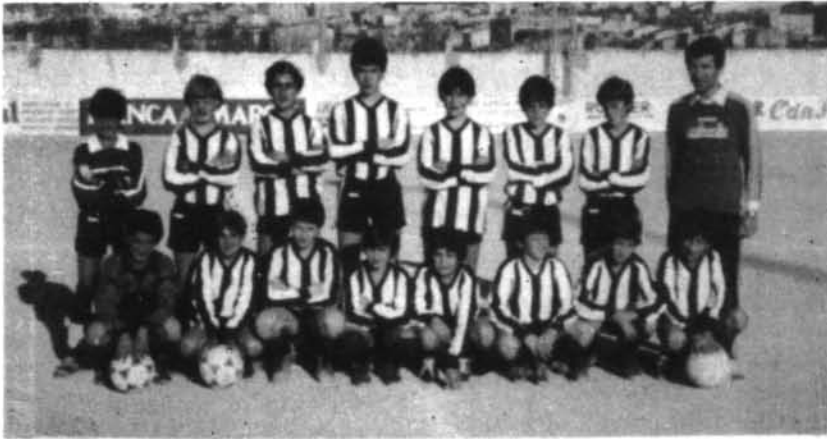
L'equip Alevin Montuïri d'enguany el qual du una bona campanya i va en el grup capdavanter de la classificació.