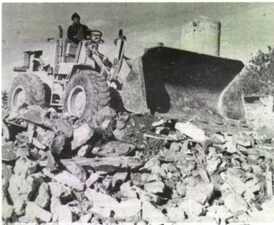
La màquina va traslladant aquestes pedres a un altre lloc a fi de deixar una esplanada en condicions de poder iniciar els fonaments del que serà l'edifici que acollirà els infants d'edat preescolar.