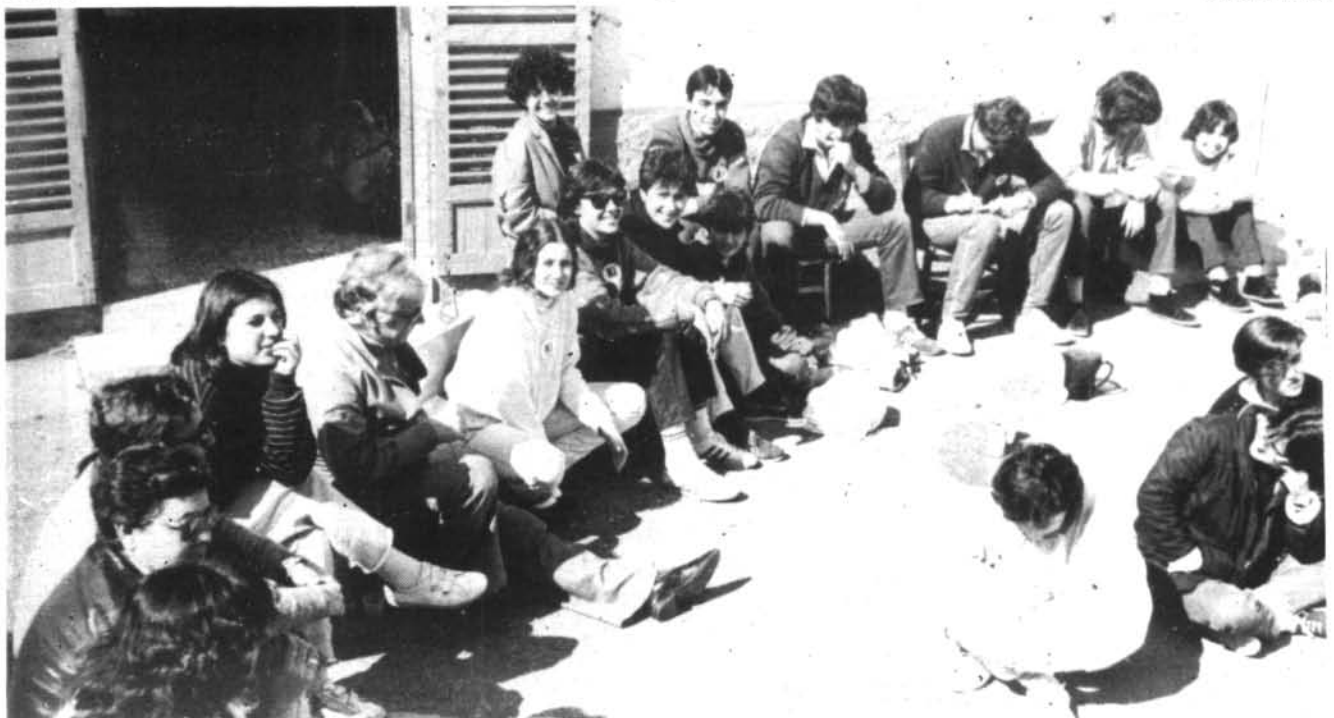
Alguns del grup de montuïrers que participaren a la trobada vocacional.

Un grup de joves i al·lotes que ja participaren amb ganes a la Trobada vocacional de St. Llorenç han volgut elaborar uns murals per a la Setmana Santa. També tenen programat col·laborar en les col·lectes i repartiments d'ajudes amb les germanes franciscanes. Llavors projecten una Eucaristia amb més aire jove per a les 11,30 de dia 14 d'abril. Junts, prepararem amb esperança el segle XXI.