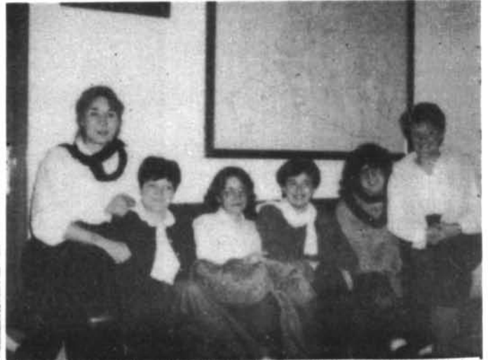
Les corredores de cotxes: No poden negar l'alegria de participar a les carreres.

«És una festa que no s'hauria de perdre» (Grup de pilots)