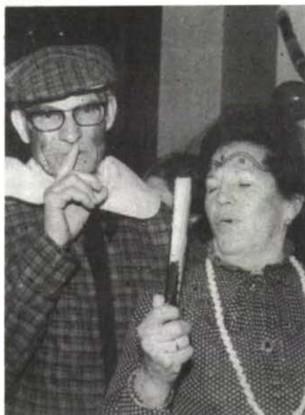
Per ventura no coneixeu aquests artistes de primera...? Varen arribar a Montuïri expressament pels «darrers dies».