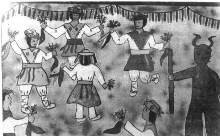
Així és la visió que tenen dels «Cossiers» els nostres al·lots. (Mural pintat a l'escola amb motiu del 50.è aniversari).