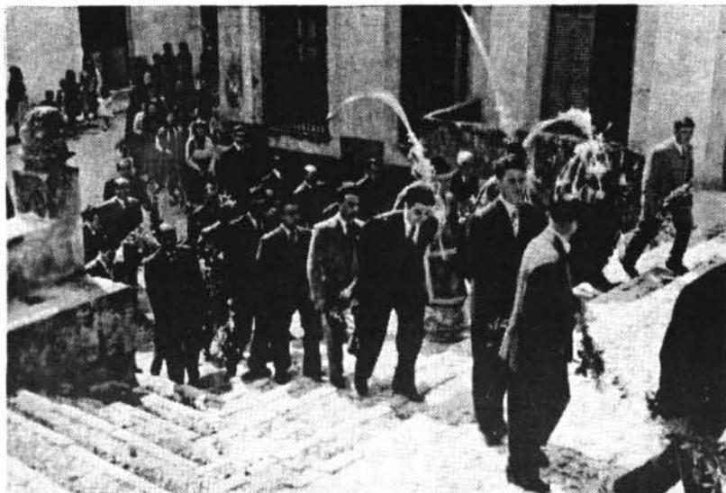
És la processó del dia dels Rams de l'any 1960 quan els homes pugen els graons davant la rectoria.

Mas i Verd». Però sempre que es realitza un acte cultural es qüestiona si és necessari o útil. Nosaltres diríem que la cultura és imprescindible perquè un poble pugui ésser lliure. La valoració que el nostre partit ha fet d'aquest acte és positiva, haver estimulat els pares, professors i alumnes a fer unes activitats extraordinàries des del punt de vista pedagògic. D'altra banda, s'ha donat a conèixer una part de la història de Montuïri, que per molts significava anarquia i desordre; i, pel contrari, s'ha mostrat la preocupació que existia aleshores per a l'alfabetització, l'ensenyament i la cultura.