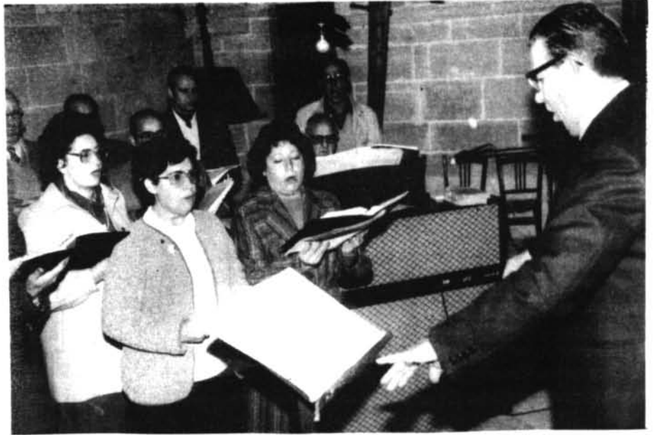
Una vegada més es va lluir la Coral Parroquial a la missa de la segona Festa i també per Cap d'Any, amb les seves interpretacions.

Els petitons de primer, segon i tercer d'E.G.B. també prendran part en un torneig de lliga doble volta. S'han fet tres equips: Dos de Cicle Inicial i un de Tercer Nivell. El mateix dia, els tres equips jugaren contra una altra escola. Així s'aprofita el desplaçament i un mateix matí o horabaixa perquè juguin els tres equips. D'aquesta manera tots els nins i joves del poble practiquen el futbol. Vegem si algun dia arribam a tenir un equip de regional format per la totalitat de montuïrers! Aquest torneig, que serà de futbol sala, comença el 12/13 de gener i acaba el 5 de maig. Les jornades estan programades preferentment per als diumenges dematins. S'encarreguen d'ensenyar aquestes promeses del futbol mallorquí En Gaspar Socias i En Joan Bauzà. Els rivals seran Cide, Algaida, Campos i Porreres.