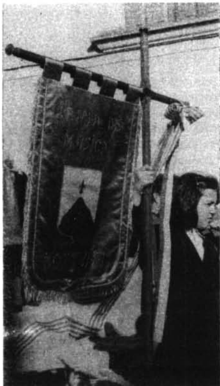
Al concert de la Banda de Música del 26 de desembre s'estrenà a Montuïri l'estandart oficial d'aquesta institució.