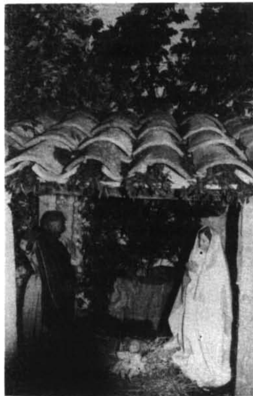
Enguany el «betlem» de l'església ha estat una porxada mallorquina. Vet aquí un detall, amb el nin Jesús, Maria i Josep (talles barroques de molt de valor).