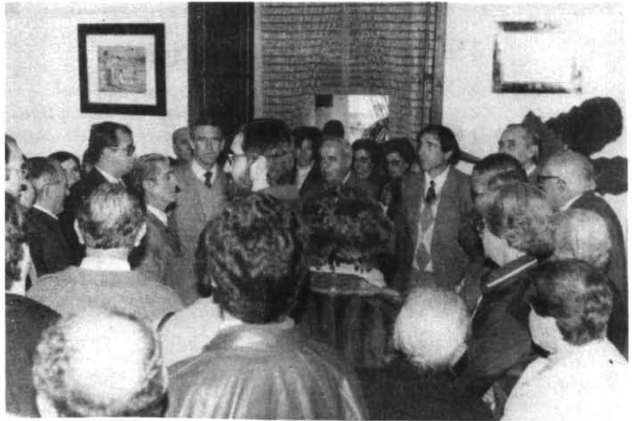
El dia de la Fira, 2 de desembre, s'havia inaugurat de forma oficial el menjador per a la Tercera Edat, al convent de Ca Ses Monges, de la qual aquesta foto n'és una recordatòria del moment.

...sa Banda de Música mos obsequià, d'una forma imprevista, amb un simpàtic concert, sa segona festa de Nadal. Vàrem poder contemplar es nou estandard i sobretot ets uniformes ben