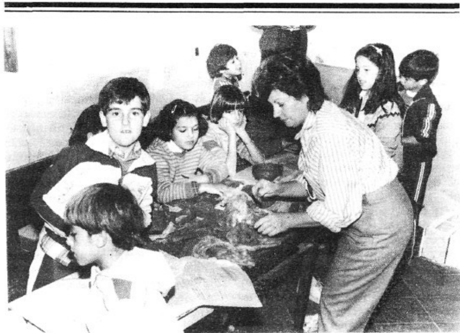
Els al·lots del Club d'Esplai amb els monitors fent sturells per a la fira.

somni que fou realitat). Per damunt tot això hi ha un aspecte que s'ha de destacar més encara: la seva professionalitat i elevat interès pel futbol montuïrer.