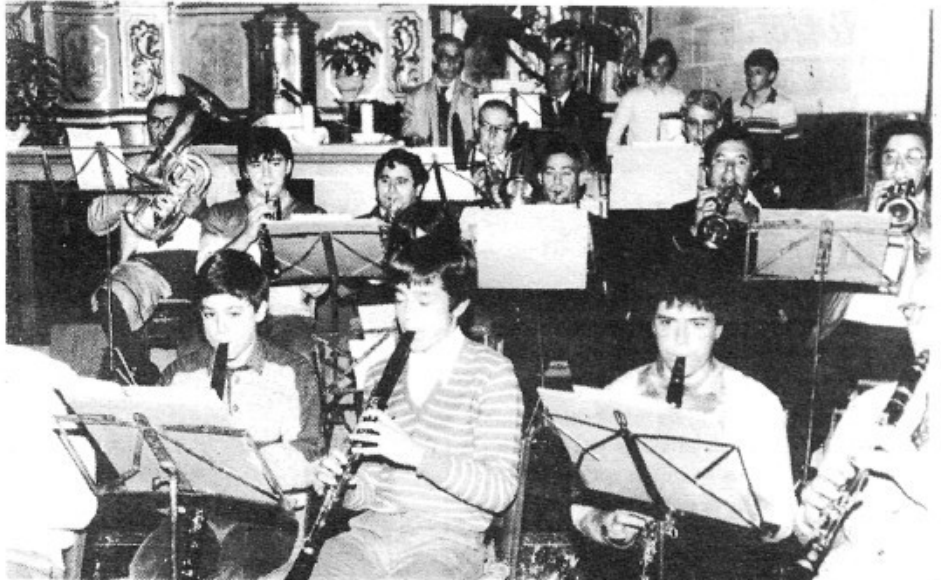
La Banda de Música en el moment que donava el concert dins de l'església amb motiu de la festa de Sta. Cecília.

... a la festa de Sta. Cecília, a l'església, es llüiren tant la Coral Parroquial com la Banda de Música; però sentirem dos em-