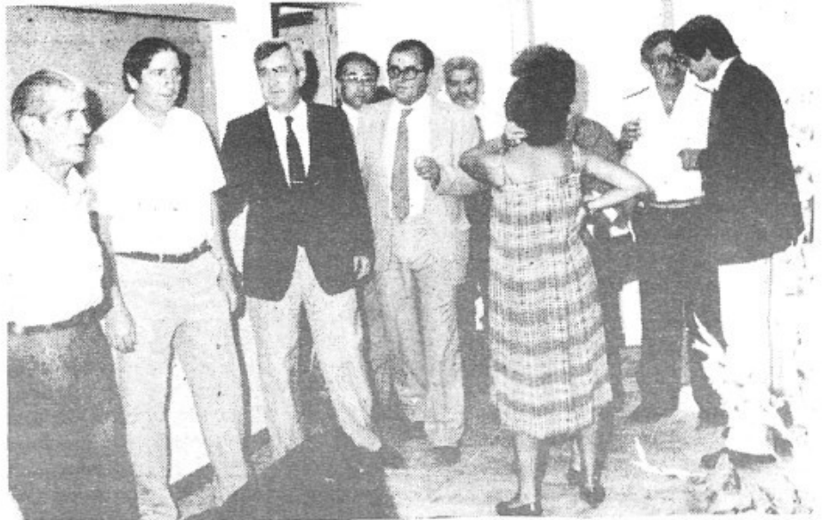
A l'inauguració del Centre de Salut hi acudiren les autoritats autonòmiques, les insulars i les locals.