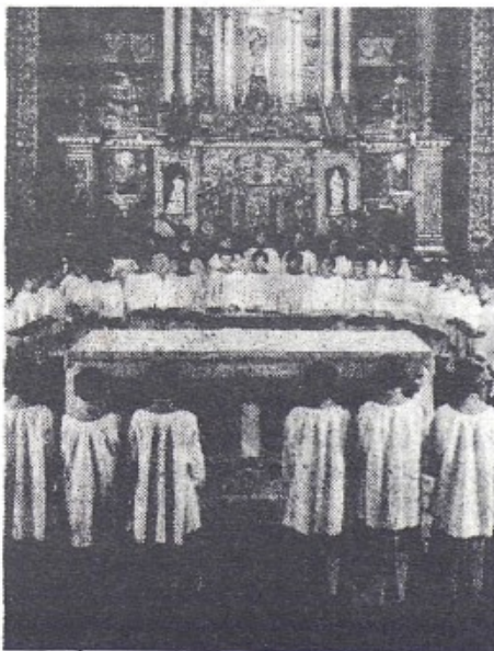
Escolania de Blavets