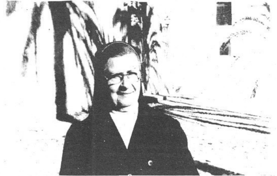
A les Monges de la Caritat