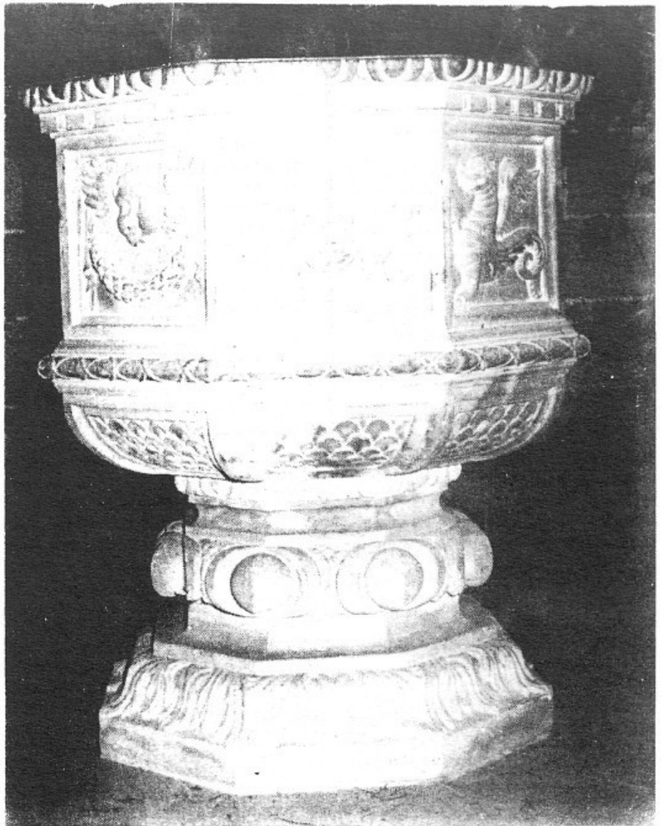
La pila baptismal de la nostra parròquia és de pedra de Santanyí del segle XVI (Escola de Joan de Salas) amb decoració en relleu protorreixentista.