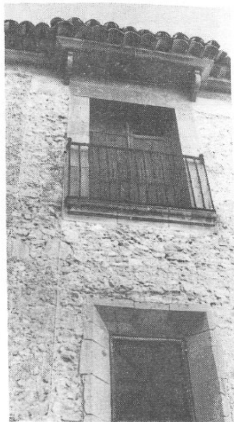
Qui no ha contemplat moltes vegades aquestes dues finestres de la sagristia!

«QUAN MIRAM ELS HOMES SOBRE LA POBRESA DELS QUALS S'HA EDIFICAT LA NOSTRA ABUNDÀNCIA I QUE VEIM DESPOSEÏTS DE LA SEVA VIDA I DEL SEU PROPÍ COR, HEM DE CONSTATAR QUE LA NOSTRA ABUNDÀNCIA ACTUAL CAMINA EN SENTIT CONTRARI AL CAMÍ SEGUÏT PEL CRIST».