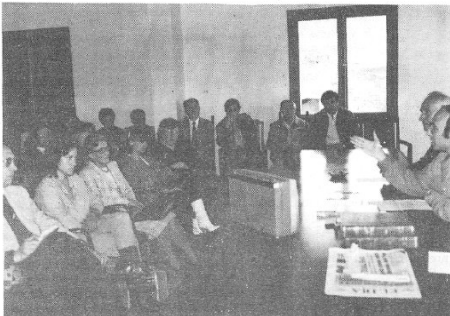
Un moment de la presentació del Llibre de Cort Reial a la Sala d'Actes de l'Ajuntament.