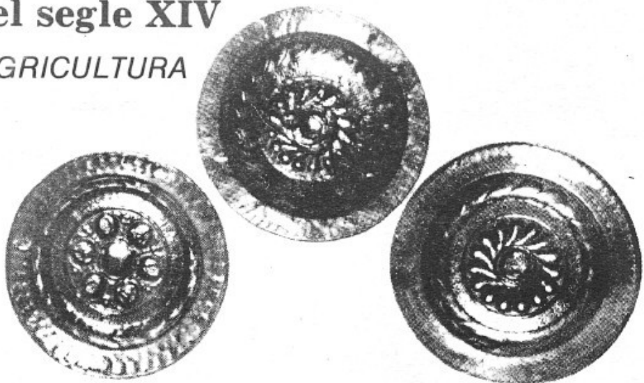
Plats de dinant de llautó repujat del segle XV utilitzats com a bacines. Es guarden a la sagristia de l'església parroquial.

La compra de gra (blat, principalment) i el consegüent endeutament, era molt comú, la qual cosa ens fa pensar que les collites no devien ésser molt bones. Després d'haver-ne retirat un poc per a menjar, un altre per a pagar censos i altres (els impostos de llavors) i els deutes, ja no quedava res; i per a sembrar l'any vinent, una altra vegada a comprar i més deutes. Era la roda de sempre.