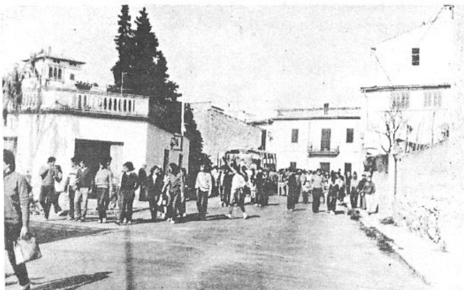
Aquesta fou la partida cap el Puig, de l'any passat. Esperem que l'animació sia enguany encara més augmentada.