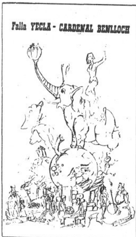
Falla YECLA - CARDENAL BENLLOCH

Dia 15 de març, la Banda de Música, amb els seus acompanyants, que, en total, formàvem un grup de 50 persones, partirem a les dotze del migdia amb el vaixell «Ciudad de Salamanca» cap a València. Arribàrem a les nou del vespre. La feina dels músics consistia amb fer passacarrers dins el barri de la falla, que comprenia els carrers següents: «Yecla», «Cardenal Benlloch» i «Santos Justo y Pastor».