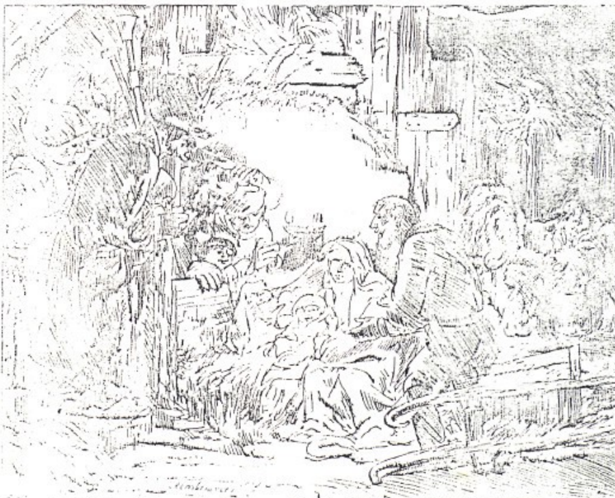
Adoració dels Pastors. Gravet de Rembrandt - Amsterdam.

Déu s'ha fet home, germans! Déu és un de ca nostra; no li fa por dir-nos germans. Dóna una volta pel poble, per fora vila, pels tallers, i si em dius on tens un germà, jo et diré on és Déu.