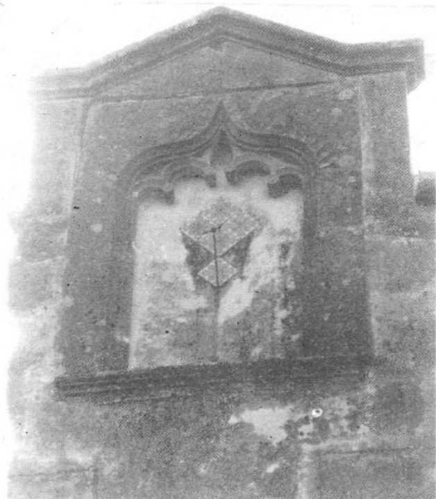
A la «foto» de damunt podem veure el rellotge de sol, d'estil gòtic florit, de la façana lateral de la Rectoria. I a la dreta, el balcó, també de la Rectoria, anomenat «balcó de Pilat», segurament perquè en l'escenificació dels «Dotze Sermons» pels carrers, sorintiria el personatge de Pilat a «rentar-se les mans» o a «pronunciar la sentència».