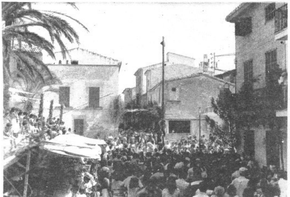
El poble de Montuïri surt al carrer quan hi ha una o altra manifestació, tengui molta o poca transcendència, es mou sempre que «val la pena». Aquí podem veure, malgrat un bon sol, la segona festa de Sant Bartomeu d'enguany, la plaça plena de gent contemplant els qui pugen al pal ensabonat.