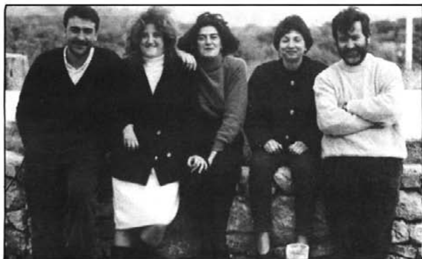
Els responsables de l'SMOE al llarg dels seus 10 anys d'història