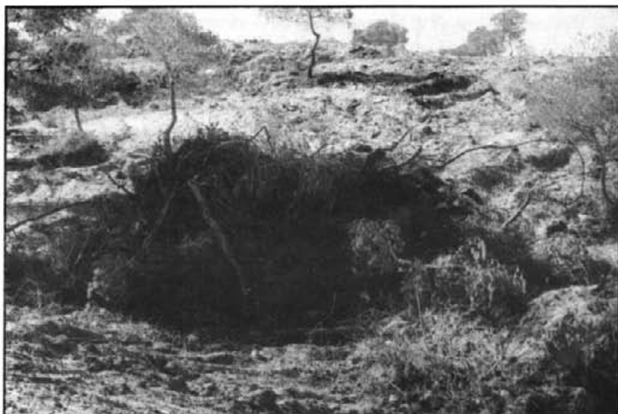
"Por aquí pasó Atila"

L'obertura de grans tallafocs i ampliació de camins amb maquinària pesada ha provocat greus danys a la fràgil vegetació de sa Canova, danys que tardaran molts d'anys en reparar-se i que potser s'agreuaran encara per efecte de l'erosió que puguin provocar.