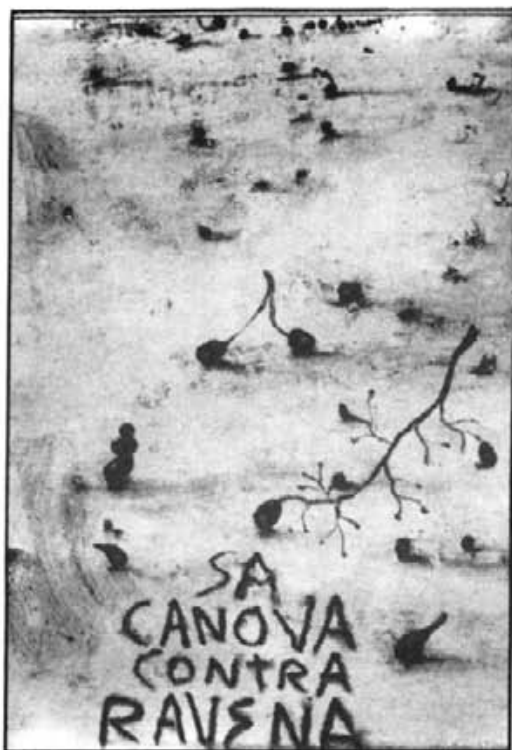
Obra cedida per Miquel Barceló

El lema reivindicatiu Sa Canova contra Ravenna tan discutit i qüestionat d'ençà que sortí a llum pública s'ha tornat deixar veure per la premsa i altres mitjans de comunicació de les Illes i de fora. Aquest cop ha estat arran d'una exposició d'obres pictòriques feta al nou Centre Cultural de Sa Nostra, a Palma. Si fa poc més d'un any un nombrós grup d'intel·lectuals i personatges destacats de les Illes expressaven el seu rebuig en contra de l'aprovació de més projectes urbanístics (entre ells el de Sa Canova), ara s'hi ha afegit un grup d'artistes de renom internacional que han oferit voluntàriament les seves obres a fi de seguir potenciant la campanya.