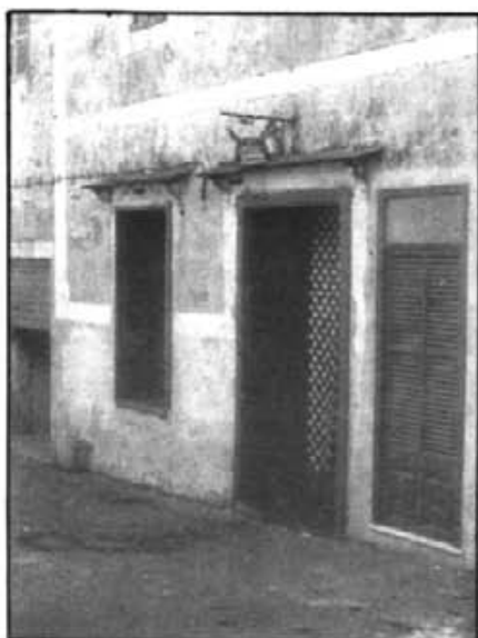
Entrada primitiva del Celler a l'any 1964, data en que es va inaugurar.

El passat dia 19 de desembre va fer 25 anys que es va inaugurar el Celler de CA'N FARO.