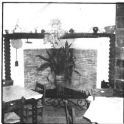
Detall de la fogaça al saló del Celler.

Enhorabona a tots i que puguin veure les noccs d'or.