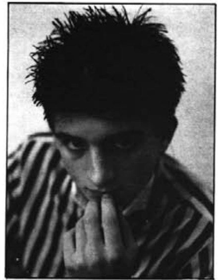
"L'emoció damunt l'escenari quan el públic t'aplaudeix és indescriptible".