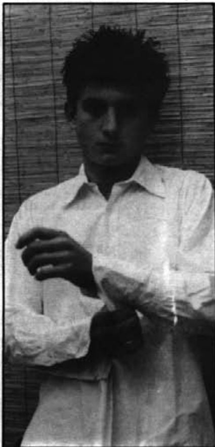
"Comença a esser hora de valorar la professió d'actor tal i com es mereix".

sort de poder treballar amb la gent del Lliure i constatar que per dedicar-te a això és necessària una bona base, conèixer bé uns fonaments als quals poder treure el màxim profit damunt l'escenari. Allà damunt t'adones realment que