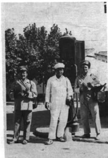
Sortidor manual que tenien al carrer de Ciutat, davant Correus.