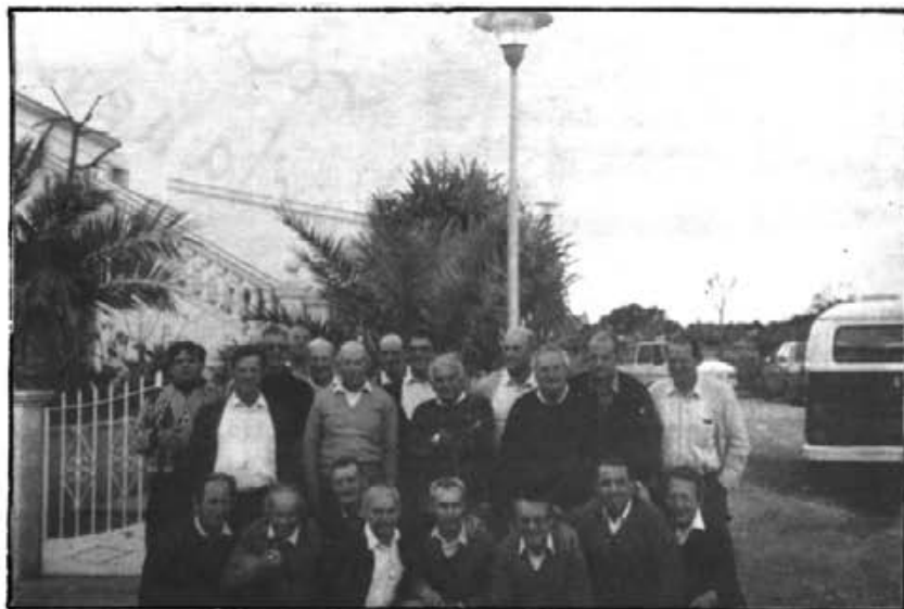
TROBADA DE "QUINTOS"

El passat dia 30 d'abril es varen reunir els "quintos" del 56 en número de 21 per a celebrar la seva trobada anual i que enguany va ser ja la que fa cinc.