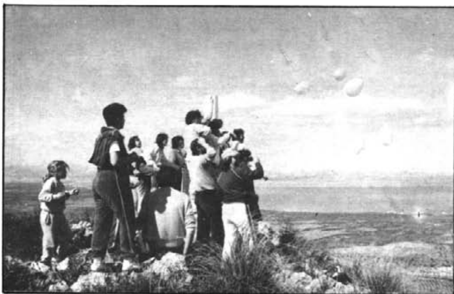
"Un raig d'artanencs" a la Atalaia Moreia

J.A.: També vàrem fer una excursió a la cova dels Albardans on férem un trempó, amb la lluna plena, i llavors ens anàrem a damunt les coves i després: un bany, devers les tres o les quatre de la matinada. Va ésser una excursió molt bona.