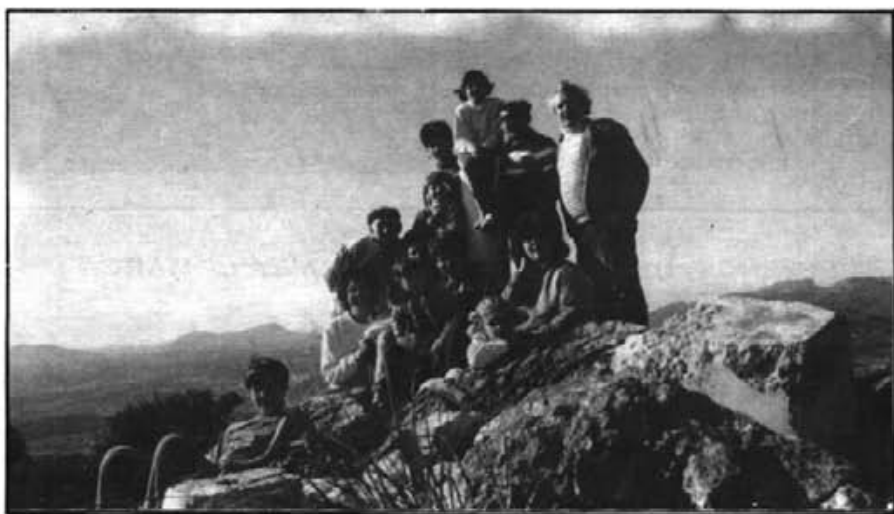
"Un raig d'artanencs" dalt la muntanya del Racó