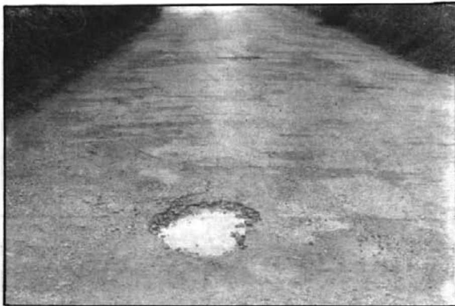
Els clots de la vila es van tapant

Les obres previstes per l'Ajuntament de cara a eliminar els clots, tant dels carrers com dels camins municipals, que s'han iniciades fa pocs dies han hagut d'esser interrompudes a causa de les plujes, que impossibiliten aquests tipus de feina. El regidor d'obres de l'Ajuntament ens ha informat que l'humitat no deixarà aferrar l'asfalt, i que s'haurà d'esperar a que el terreny s'aixugui; també ens ha explicat que el pla previst per aquesta feina inclou un repàs complet a tots els carrers del casc urbà d'Artà i la Colònia i a la xarxa de camins veïnals que depenen de l'Ajuntament, per ara ja s'han arreglat més de la meitat dels carrers d'Artà, i malgrat els contratemps s'espera que abans de l'estiu s'hagi realitzat en la seva totalitat.