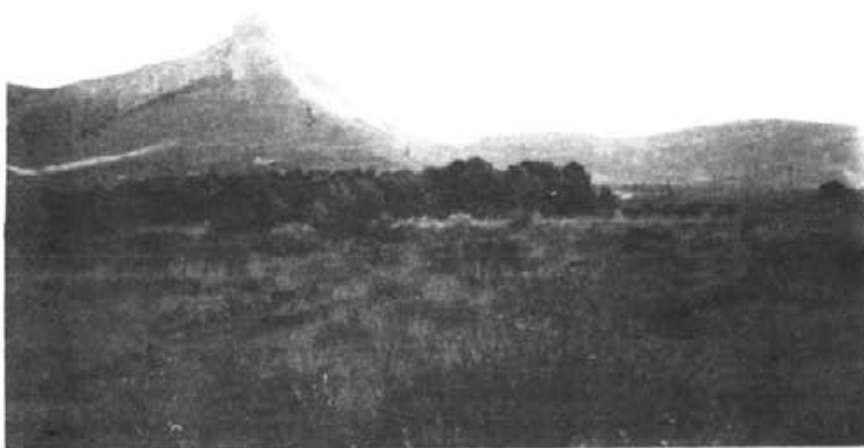
Autor: Rafel Melis Tous. Farrutx.