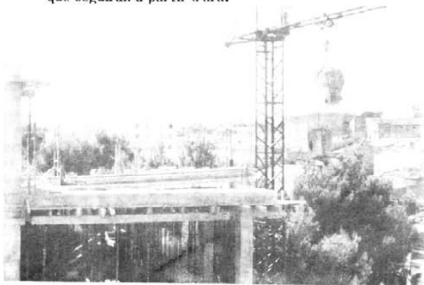
Les NISS regulen la construcció al nostre Terme Municipal

Un pic aprovat l'Avanç de Planejament Inicial, les Normes Subsidiàries han entrat a la recta final. A la plana 7 hi ressaltam algun dels seus continguts i les passes legals que seguiran a partir d'ara.