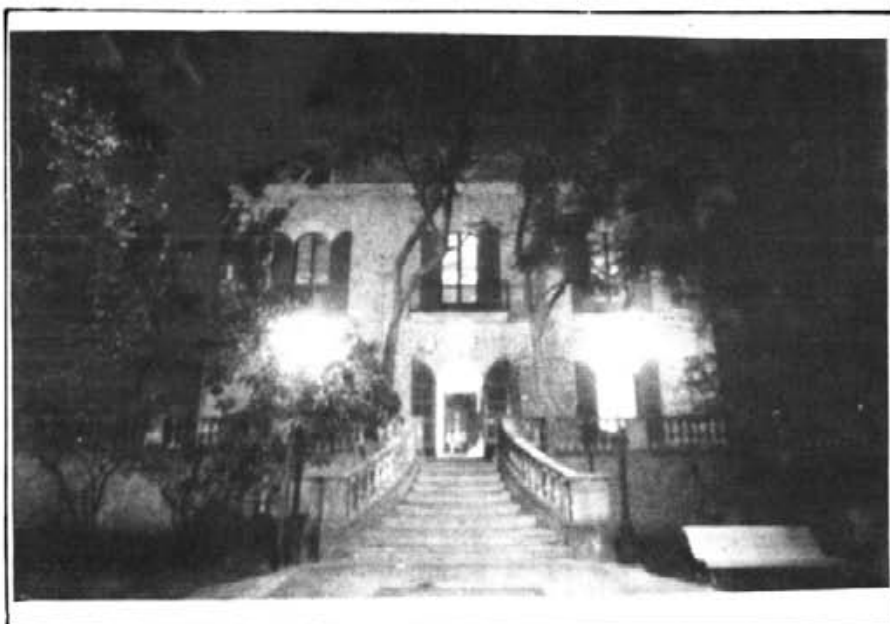
Aquesta fotografia d'Agustí Torres figurarà al catàleg que s'editarà amb motiu de l'exposició

sarasate, pujol, massanet, bru, forteza, ventayol, jeroni, carrió