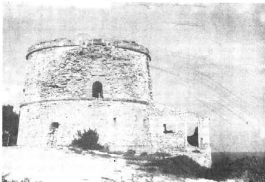
Autor: Joan M. Rayó. Torre d'Aubarca