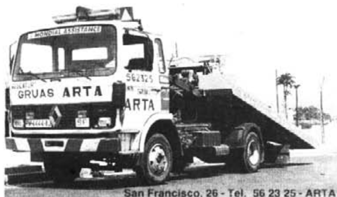
San Francisco, 26 - Tel. 56 23 25 - ARTA