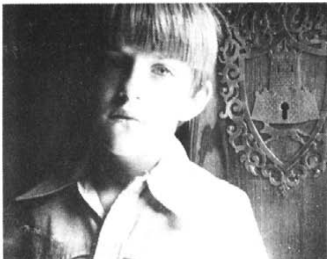
Juliol del 1973. Els ORELL de Menorca tornen a Llubí.

no tingué l'obligació de tornar a caseva per a fer el servei d'armes. D'aquí tota la posterior desconexió amb la seva casa i amb el seu poble.