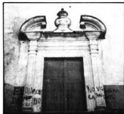
Façana de l'església del Convent