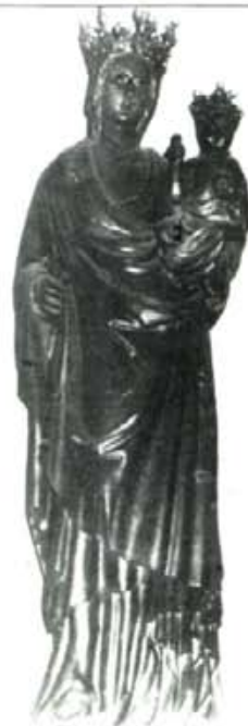
Mare del Dñu de La Seu, imatge del segle XV.

Recordam que la propera setmana tindran lloc a la nostra parròquia d'Artà unes Conferències de Quaresma amb la participació del Bisbe.