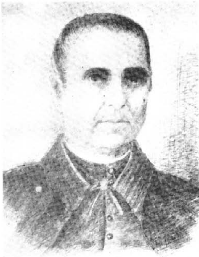
Sac. SEBASTIAN GILI VIVES

Totes les religioses Agustines, Germanes de l'Empar, dia 11 de setembre de l'any 1969, setanta-cinc aniversari de la mort del Fundador, al peu del seu sepulcre, convençudes de la seva santetat, feren vot espontani de la promoció de la causa de la beatificació.