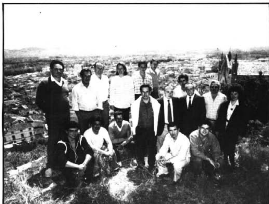
GENT D'AVUI PENSANT EN DEMÀ