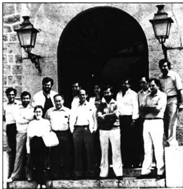
Consistori elegit a les darreres eleccions municipals.

En la composició del Consistori dels darrers quatre anys, globalment ha existit una "majoria" que ha treballat i una "oposició" que els ha deixat treballar, exposant els seus punts de vista i les seves crítiques constructives, que a vegades han estat acceptades i la majoria, ignorades.