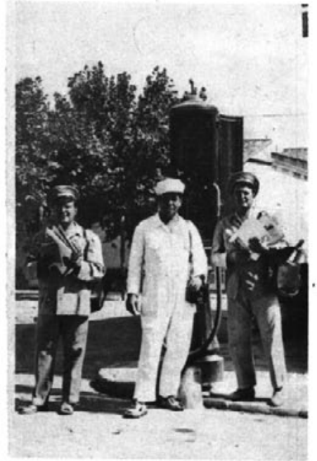
El dia 20 d'agost de 1962, en que es tancà el surtidor de "Ca'n Sopa".

J.- Sí, sens dubte. Es una professió molt entretenguda. Sobretot abans, quan anàvem a peu, i a l'hivern no hi havia xubasqueros, ni "katusques", i els carrers, quan plovia, estaven plens de bassots, era tota una aventura anar a repartir a les fosques. Però també era més divertit.