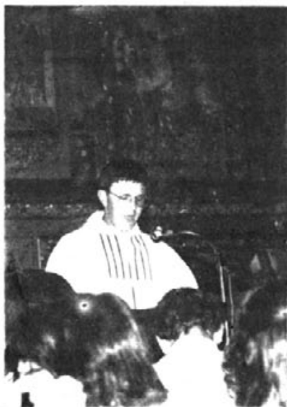
(Ive de portada)

Monges la sala on s'havia de fer el berenar i les dones cuidaren de recollir del poble les viandes. Es va fer neteja de l'Església i Casa d'Exercicis i tot quedà llest per la cerimònia. El poble havia correspost.