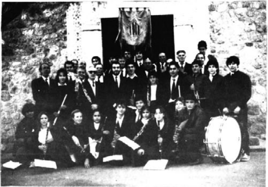
Banda Ntra. Sra. de Sant Salvador, al complet.

J.- La necessitat instrumental actualment és la part de trombons, bombardinos i baixos. Tal volta s'hauria d'inculcar als nous educants que agafassin dits instruments ja que