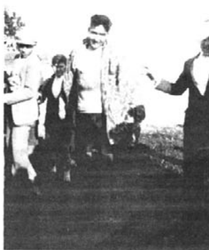
Llegada de la 2ª Etapa.