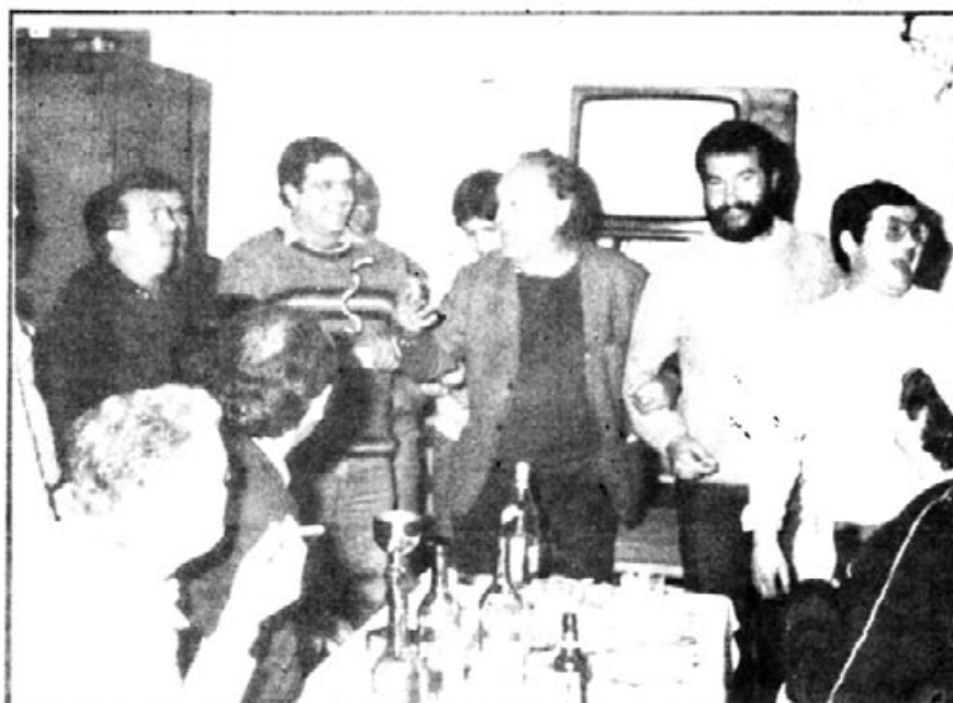
Entrega de trofeus. El primer fou cedit pe'n "SARASATE".