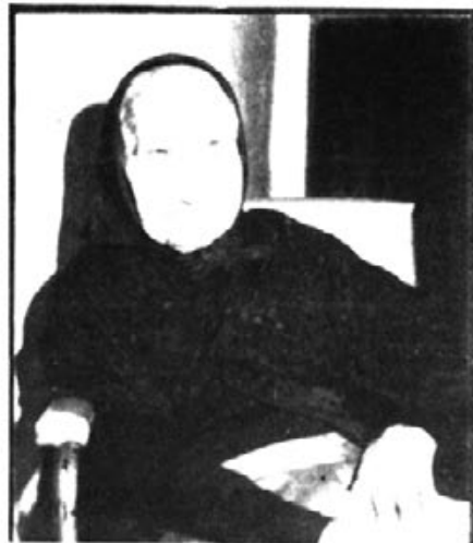
HA MORT MADO PERETA

El passat dia 9 de febrer morí la padrina d'Artà.