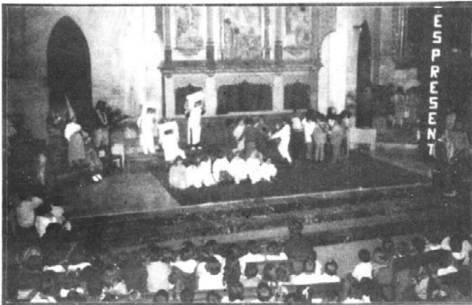
19 de desembre, celebració de Nadal pels tres col·legis d'EGB.