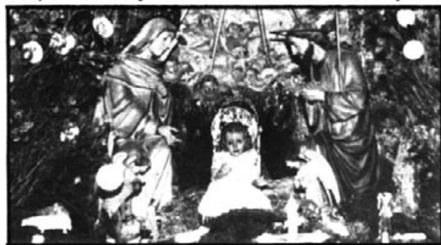
Naixement de l'església del Convent.