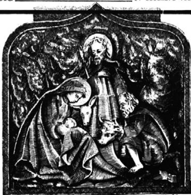
Relleu esculpit d'un misteri de S. Salvador

El dia de Nadal, les madones es deixondien dejornet i, mentre tothom dormia, adesaven el menjador i començaven a preparar el dinar. Els gusts canvien d'un lloc a altre, per Castella megen xot rostit, endiots i besuc al forn però donen més importància al sopar de la vesprada. Per Galícia el peix tira part i mitja. Els andalusos són partidaris de l'endiots encibat amb anous, i els catalans, que fins a la Guerra Civil s'havien decantat per l'escudella, quan el nivell de vida augmentà passaren a altres menjars més suculents, al.légant que l'olor de la col bollida era ofensiu. Aquí a Mallorca hem estat de sempre molt aficionats al porquim. L'antiga expressió: "Bon dia que Déu mos do, per Nadal una porcella i per Pasco un moltó" no és pasta-