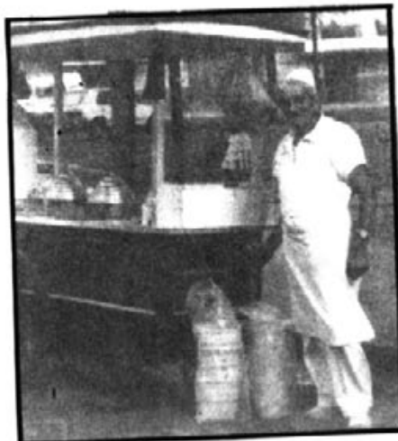
Carretet de Ciutat, igual al que pesetjava En Gaspar.

B.- Segur que l'any qui vé, al complir els 65 anys et retirars de la vida activa del nego-