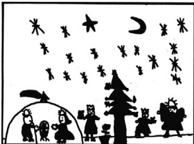
Pau Piris 2 on d'EGB.