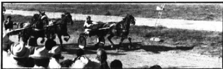
HARITA. pel cordó. guanya a Ne Marino (de'ora) i a N'History (mitg).

Tres carreres resumeixen aquesta reunió. Sa tercera carrera, amb nirvis i guanyera per part de tres productes artanens: N'Harita, Na Marino i Na Fophi. Les forces estaren tan igualades que no podem afirmar qui s'en durà el gat al sac a les pròximes reunions, i després els dos Premis Especials de la Comunitat Autònoma amb demostracions clares de la seva tècnica per part d'En Cartumach i d'En Gamin Disigny.