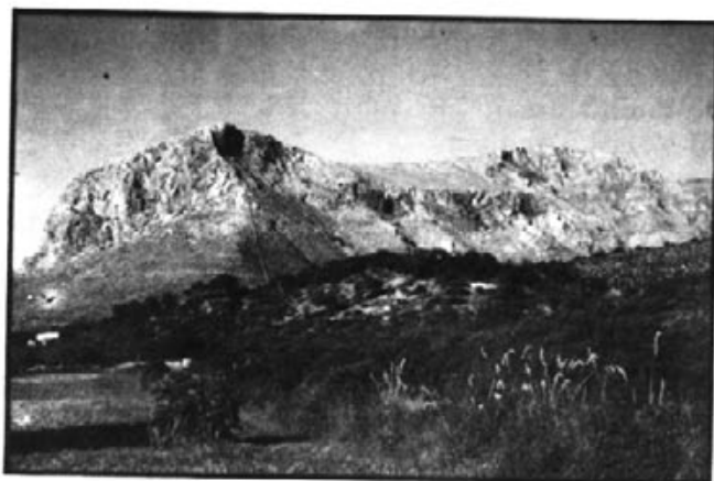
I aquell estol de muntanyes... que "l'ardor les infla el gep.