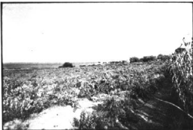
Els avis començaren la tasca de sembrar arbres i vinyes.

A la plaça i a càrrec del grup CUCORBA, jocs, cançons i danses, per a tots els nins i nines. (Entrada gratuïta).