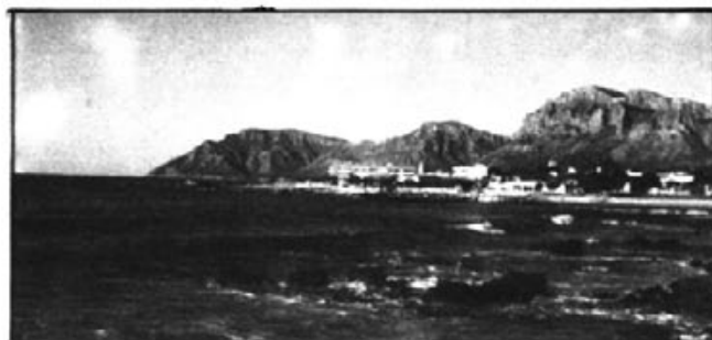
Poc a poc el llogueret esdevingué poble.