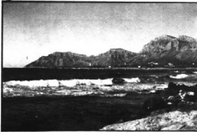
El sol pinta els colors de l'arc de Sant Martí a les muntanyes de llevant.