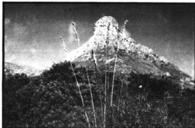
Mont Ferrutx sentinel·la de la Colònia.