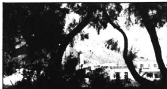
Els tamarells fan de paret.

Pot ser bé que els pins coneguin d'on apleguen tantes forces, però, són tan poc xerraires..., i això fa que molts sospitin si tenen pactes firmats.