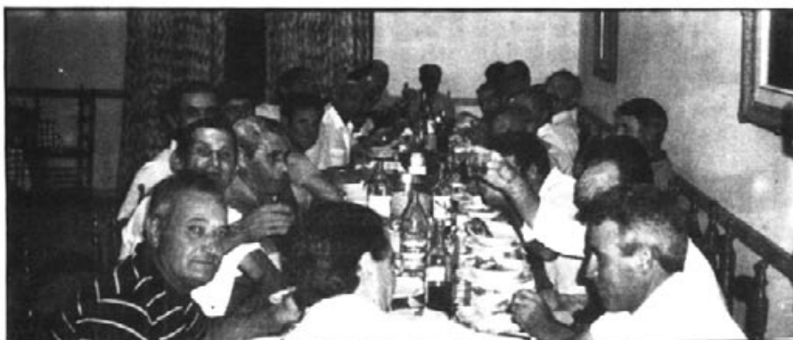
Els "quintos" del 56, celebrant l'aniversari.