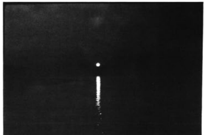
El pint de sang les muntanyes de ponent.