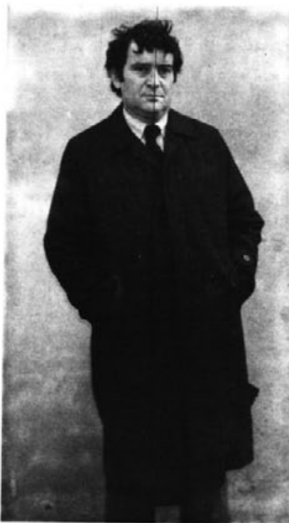
El Sr. Cardell, entrenador actual i que té una mala papereta per salvar l'equip.