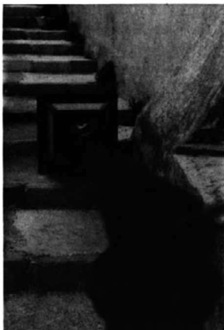
Groc, Verd i Negre...

AL MIRADOR de l'Església també hi falta "mà de metge". Fa molta d'estona que també està olvidat de la mà de Déu, i això no és bó. Al menys per aquelles persones de fora que venen a nocés i funerals, no se'n duguin una mala imatge del nostre poble. I a s'escala de Sant Salvador hi havia una farola pen terra. Creim que en tot això que hem exposat hi ha bastanta de feina per fer d'aquí a ses festes, no vos pareix?.