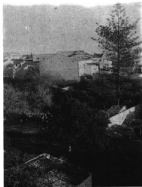
ZONA DEL TEATRE

Agreim aquestes paraules aclaratòries del Sr. Batle i'el deixam al calor de la seva família i de la seva nova ximenea econòmica.