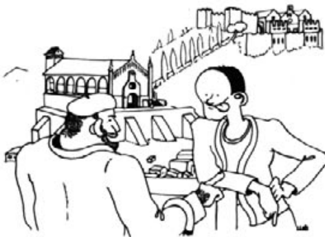
Groc, Verd i lo que sigui.

cions locals. Com més va, més es foc pren força, i per acabar-ho de fotre es "nostro" locutor de R.B., va dir coses que podia haver callat. I noltros que creim que Artà era un poble molt ben avingut. I que hi anàvem d'errats de comptes.