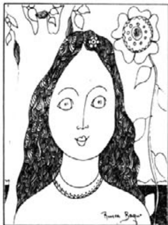
LA AVENTURA DE VIVIR