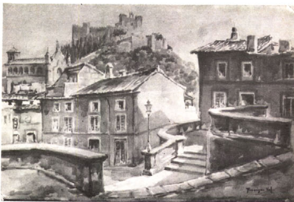
Aquarel·la de Francisco Val

"Ja arriben ses festes", "Serà abans de festes", "Ho veurem després de festes", "Passat festes vendrà".