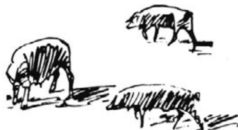
porcs negres mallorquins