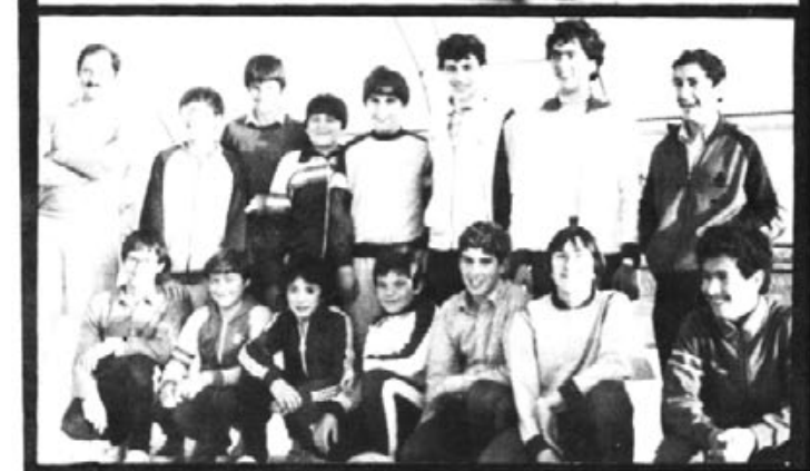
Juniors que han reforçat l'equip senior.