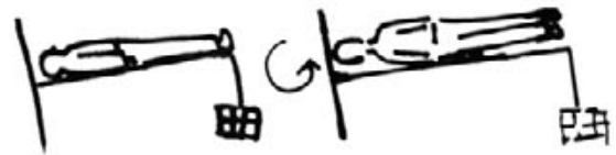
FIG. 2. DRENAJE POSTURAL

La tos puede ser "seca" (también llamada irritativa) carente de expectoración y "húmeda" (también llamada productiva) cuando se acompaña de esputo o flema. La única tos que debe calmarse es la tos "seca" o irritativa paroxística, que no se acompaña de flemas o espútos y que deja extenuado al enfermo. La tos productiva o "húmeda", que se acompaña de secreción, debe ser respetada o ayudada, ya que si la suprimimos las flemas inundarán los bronquios, produciendo obstrucciones y posiblemente infecciones secundarias. En el caso de tos con expectoración (flemas o espútos), se puede ayudar ésta aumentando la ingesta de líquidos (agua, zumos, leche) para que así el moco aumente su contenido hídrico, se haga menos viscoso y pueda salir fácilmente con el golpe de tos. También es importante para ello el drenaje postural, consistente en ayudar la expectoración por medio de la postura. (Los bronquios tienen un trayecto descendente estando de pié, si acostamos al enfermo en un plano inclinado y le hacemos girar sobre su eje, conseguimos facilitar por deslizamiento la