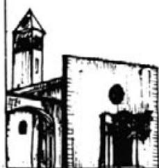
Recinte emmurallat de Sant Salvador d'Artà on té lloc, cada any, l'acte de S'ENDAVALLAMENT.

VETLLA PASQUAL "Al.leluia. Ha ressuscitat i anirà davant vostre"