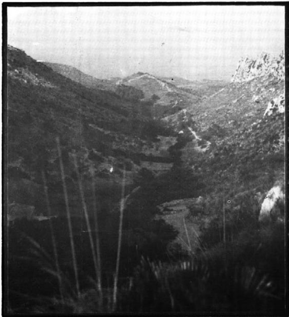
Cases des Verger i comellar.

Vos tendrem informats si surten més notícies damunt aquest tan important tema.