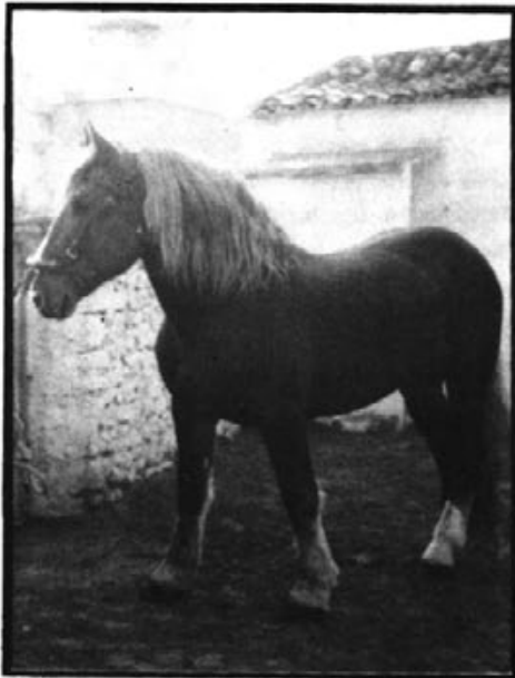
"URRACO", caballo de tiro de 9 años.