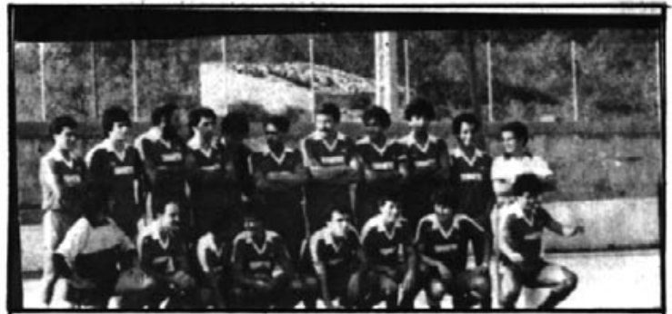
Un equipo que al principio parecía muy optimista, pero, ¿qué mal se han puesto las cosas. Eran 18, y ahora, ¿Cuántos son?.

Desde principios de temporada se ha lamentado la falta de delanteros y de un medio creador, que apoye hacia adelante con fuerza y con ilusión. No ha sido así, y poco a poco se tocan las consecuencias, y ¡aún no se pone remedio!.