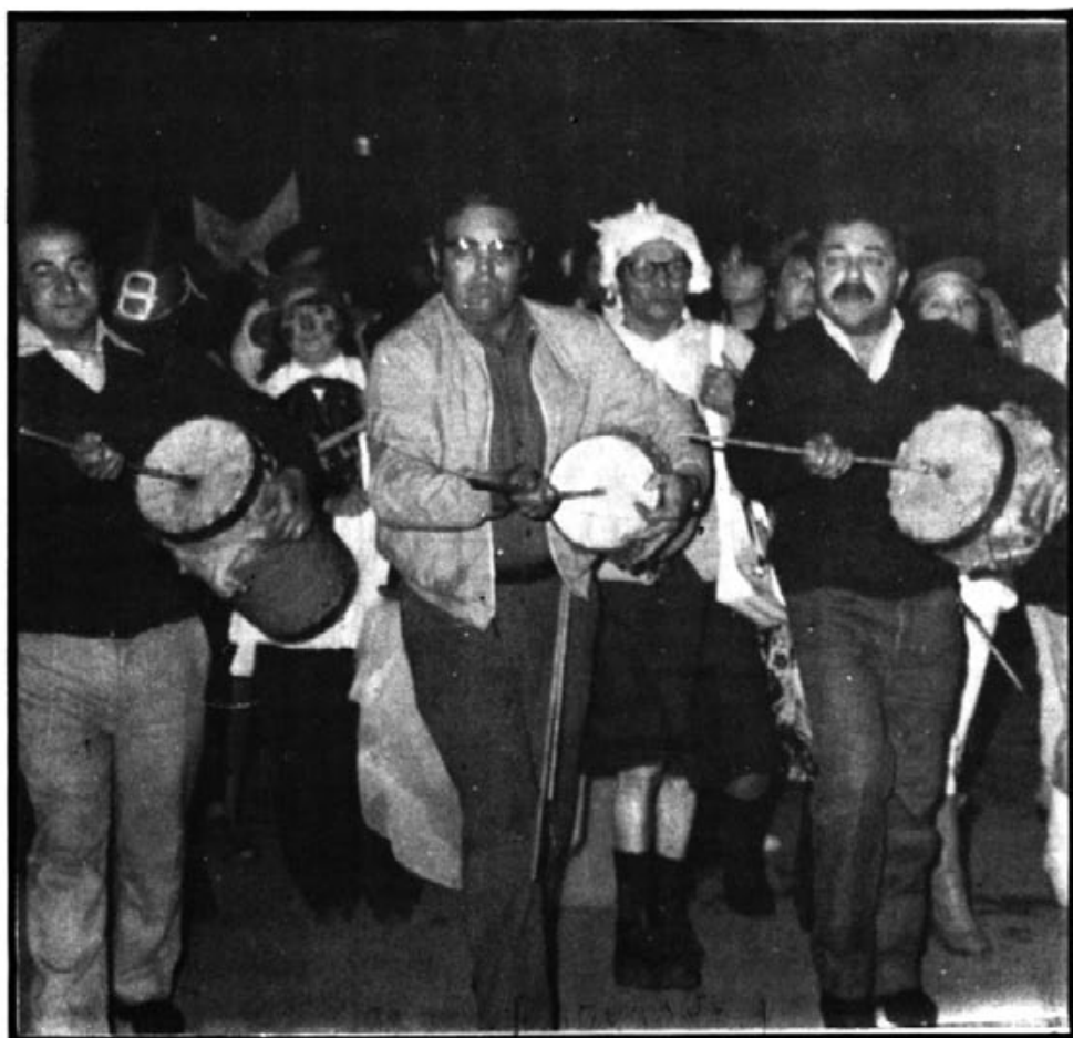
De Sa Rua de l'any passat.