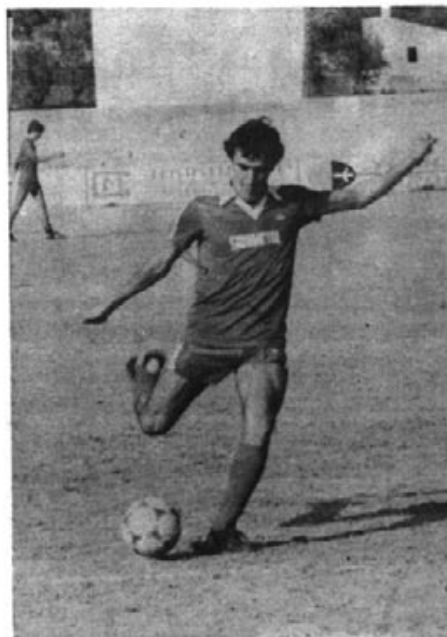
PLANAS.- Pundonor y fuerza. ¡Qué cunda el ejemplo!

*** Se jugó muy lentamente y si bien se luchaba, era más un juego de corazón, que un juego de cabeza.