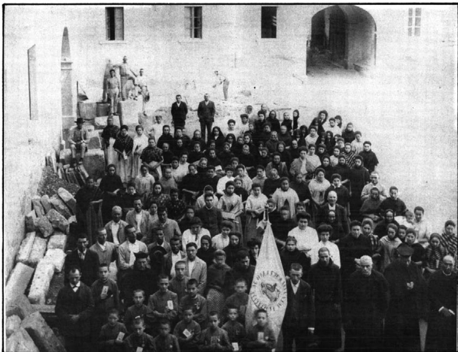
LA PÈREGRINACIO D'ARTÀ A LLUC DE L'ANY 1909

Día 10 d'octubre de l'any 1909, a l'acomplir-se els vint-i-cinc anys de la Coronació de la Mare de Déu de Lluc, un gran estol d'artaneücs anà a Lluc en carros, diligències i gales.