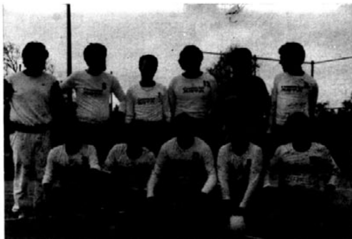
Plantilla equip "voley-bol".