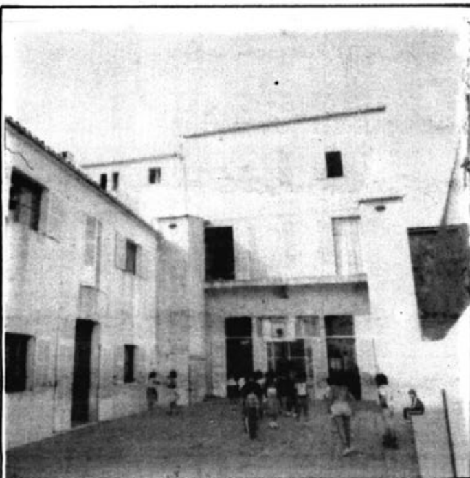
COL.LEGI SANT SALVADOR

S'ha iniciat, a Artà, una ESCOLA DE PARES, que vol ser una ajuda molt eficient, davant la problemàtica que sempre comporta l'educació dels nostres al.lots.