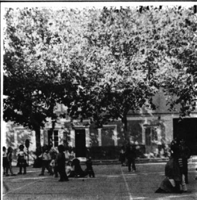
COL.LEGI ESTATAL D'EGB