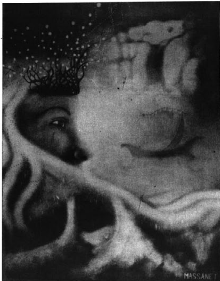
Magnífica pintura del jove artista S. Massanet, fotografiada per P. Sancho.

Veient-ho ja tot perdut, el gran jerarca, en prova de què ja mai la història parlaria de la seva humiliació, amb un gest majestuós, i en presència dels ministres, es va arrabassar els seus cabells blancs i també la barba. I, perquè els invasors no trobassin ni els ossos, va manar als joves que fessen feixos de llenya seca. Carregats els joves amb la llenya, se n'entren tots dins l'augusta i fantasmal cova. Quan arribaren a la gran sala del déu ocult, feren allà un gran fogueró.