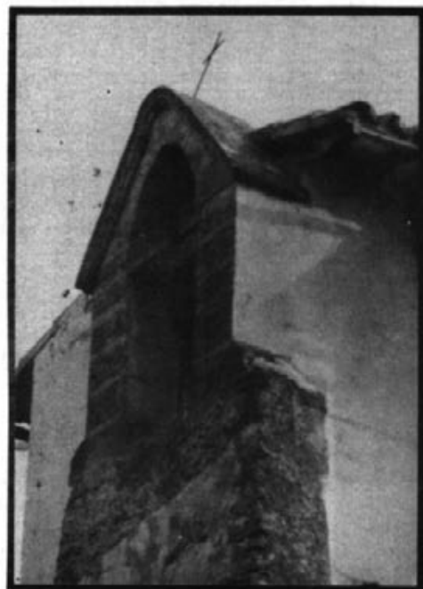
Campanaret de l'oratori de l'hospital d'Artà.

Devers l'any 1570, Jaume Font i Antoni Font, germans, fan tres sous per unes cases i hort que posseeixen davant el sitjar de