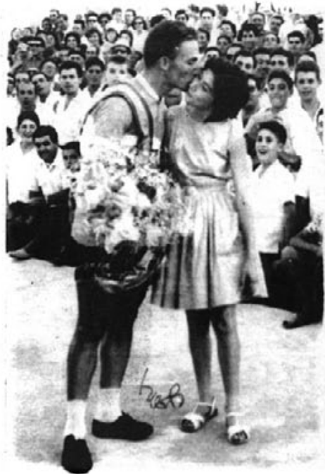
Ganador del Campeonato de España en Artá allá por los años 59

Posteriormente me preparé para el record de la hora, y después de dos meses de entrenos y con un llenazo impresionante en el velódromo local rodé media hora a una velocidad de 46/47 Kms., siendo mi handicap los últimos 20 mi-