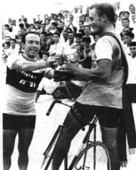
Record de la hora amateur.