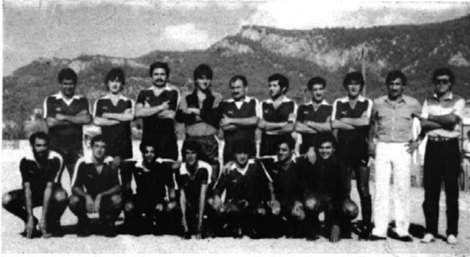
Otro año en TERCERA

Fuerza, lucha, garra y también juego fueron las armas que empleó el Artà para superar a uno de los "gallitos" de tercera.