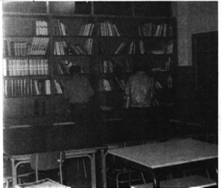
La biblioteca convertida en aula.