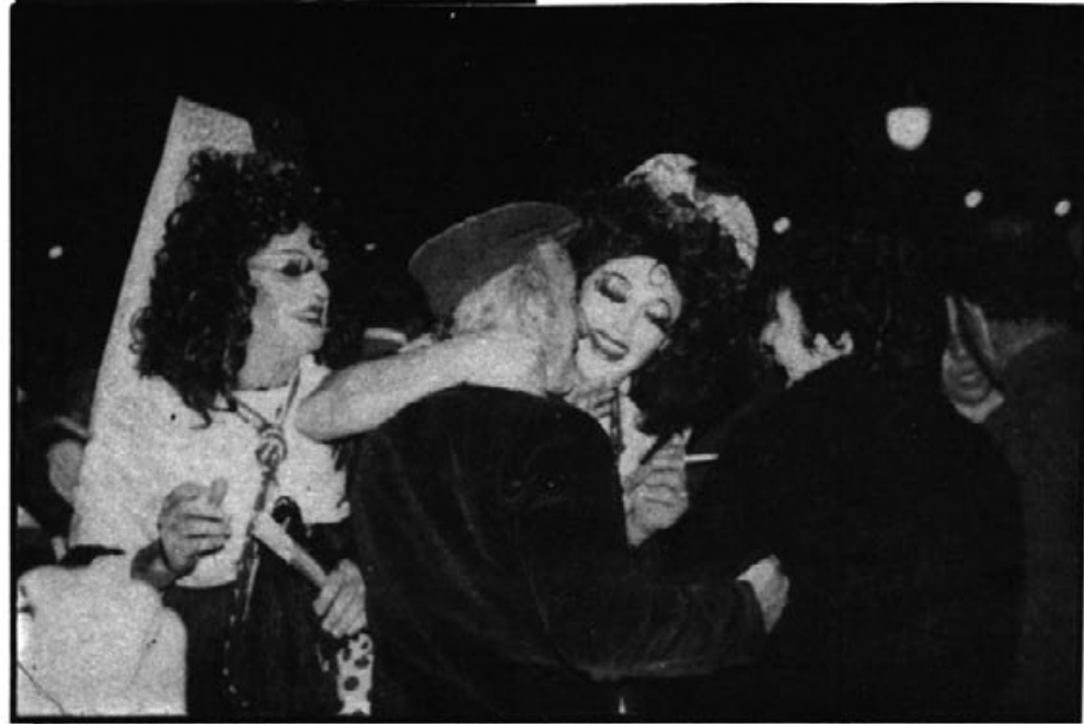
SA XIMBOMBA... (viene pág. 7)

(sin ánimo de gloria) fueron para nosotros. 1º éramos la única comparsa de ximbombers, y 2º que lo primitivo de "els darrers dies" son las ximbombas como instrumento.