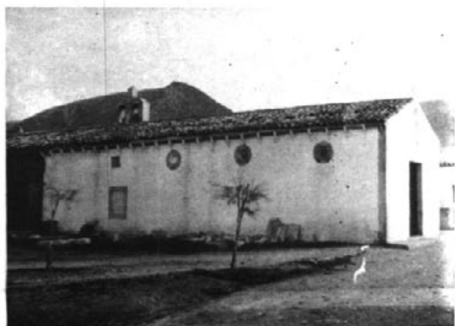
Primera capella de la Colònia