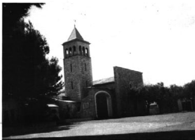
Actual temple de la Colònia

Cents anys de vida parroquial d'un poble.