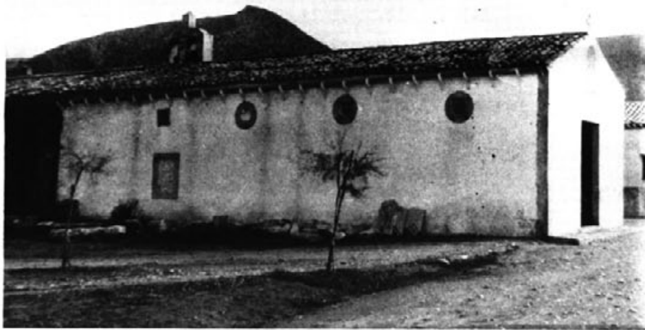
Primer temple de La Colònia de Sant Pere beneït l'any 1882.