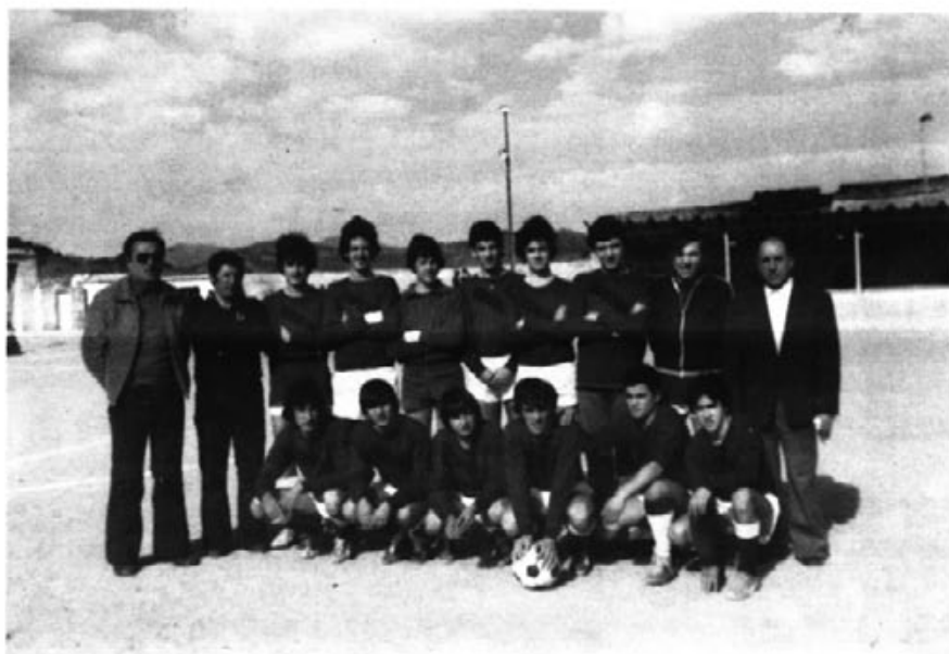
Juveniles de antaño.

Con cuántos de ellos contamos en la actualidad?