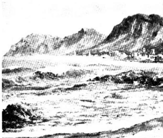
Cuadro de C. SANCHEZ

posible antigüedad. El interés de la Directiva de esta Exposición es de dar a conocer a la generación actual los cimientos de donde venimos quienes estamos y vivimos en este pueblo.