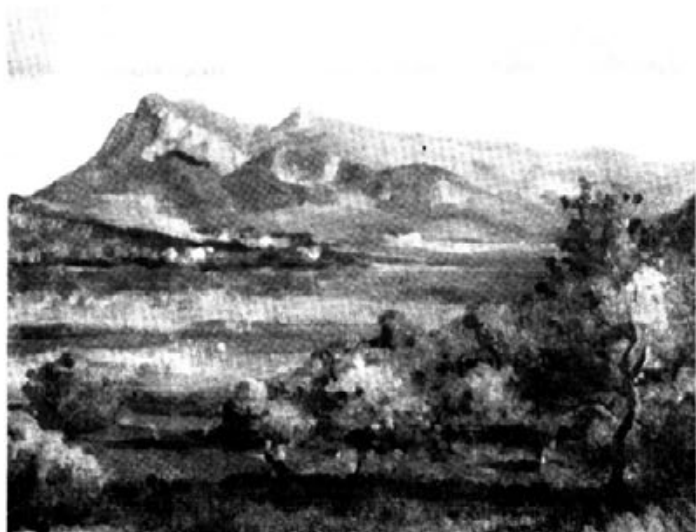
Cuadro de F. LLORCA