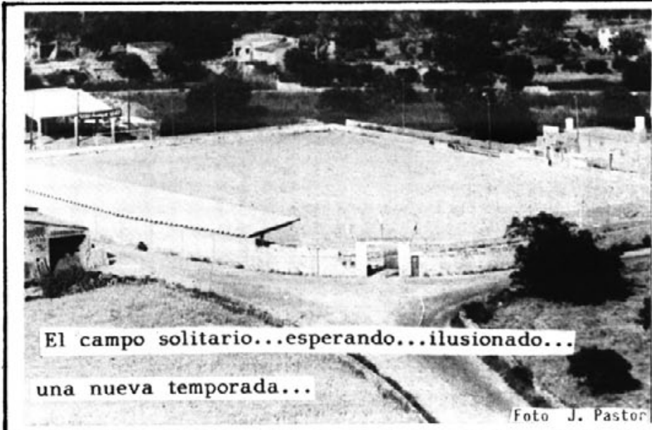
El campo solitario...esperando...ilusionado...