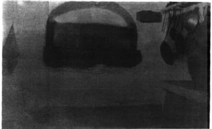
Cuina de Sa Cova

CREPELLS: -De la pasta sobrant dels robiols (és a dir, de la mateixa pasta) s'acostuma a fer crespells, estrelles, galletetes i altres peces que s'enfornen al mateix temps que els robiols.