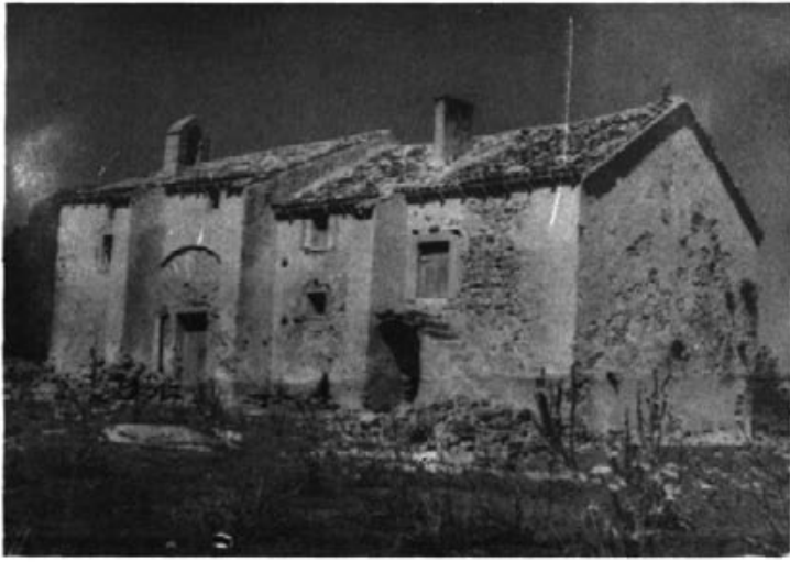
Església de Bellpuig. Vista completa de la part que dóna a mitjorn.

Els frares premonstratosos de Bellpuig d'Urgell foren porcioners de Mallorca, després de ser conquerida l'illa pel Rei En Jaume I, havent béns a Ciutat que ben prest traspassaren i, a Artà, vuit alqueries.