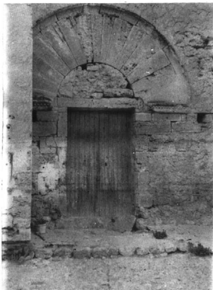
Portal principal de l'església de Bellpuig, amb arc de mig punt damunt capitell, imposta de motlura cistercenca.

sió de Bellpuig. La part que formava el presbiteri és avui l'estable i on hi havia l'altar hi ha la menjadora de les bèsties.