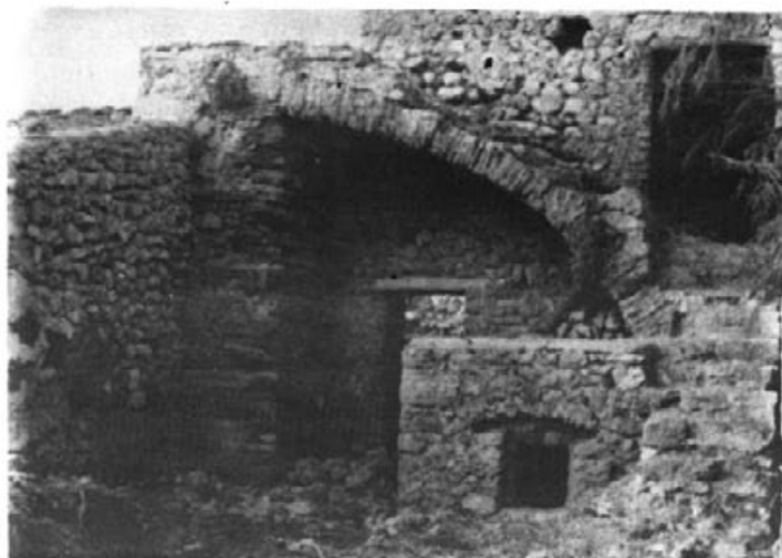
Escala que pujava a les sales principals del monestir. Aquesta edificació encara es diu "Es Col·legi".

Sembla que l'any 1421 els frares de Bell-